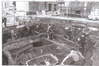
Сруб дома обнаружен на месте строительства гостиницы

На протяжении ряда лет стройка была заморожена. Но как только работы возобновились, застройщик пригласил в Новогрудк специалистов из Института истории Национальной академии наук Беларуси.